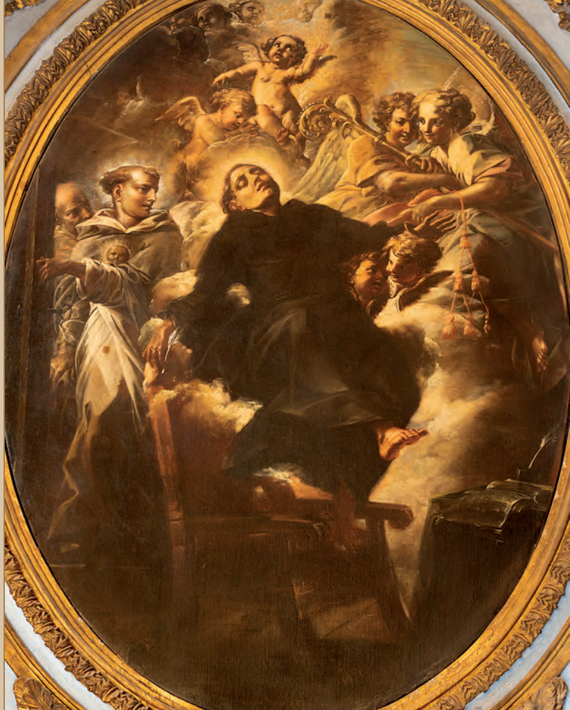
Biagio Puccini, Saint Bonaventure en extase (1708). Roma, église de San Paolo alla Regola

proposée dans la conclusion du fameux opuscule Itinerarium mentis in Deum : « Si vous demandez comment adviennent ces choses demandez la grâce, et non pas l'instruction, ni la compréhension... non pas la lumière, mais le feu qui nous enflamme complètement et nous porte en Dieu » ( Itinerarium VII 6 ).