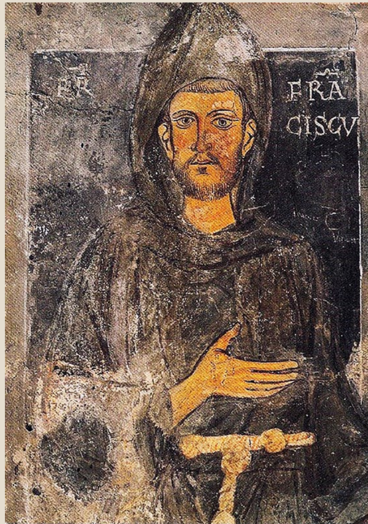
Premier portrait de François d’Assise fresque de la chapelle Saint-Grégoire du Sacro Speco (1224)

Extrait du Messager de Saint-Antoine Auteur : Pierre Moracchini