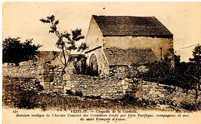
117 VEZELAY. — Chapelle de la Cordelle, derniers vestiges de l'Ancien Couvent des Cordeliers fondé par frère Pacifique, compagnon et ami de saint François d'Assise.

poètes par le futur empereur Frédéric II. Par la suite, le frère Pacifique aura des fonctions importantes dans l'Ordre comme fondateur de plusieurs couvents de frères et visiteur des clarisses. On le considère comme le premier Provincial de France.