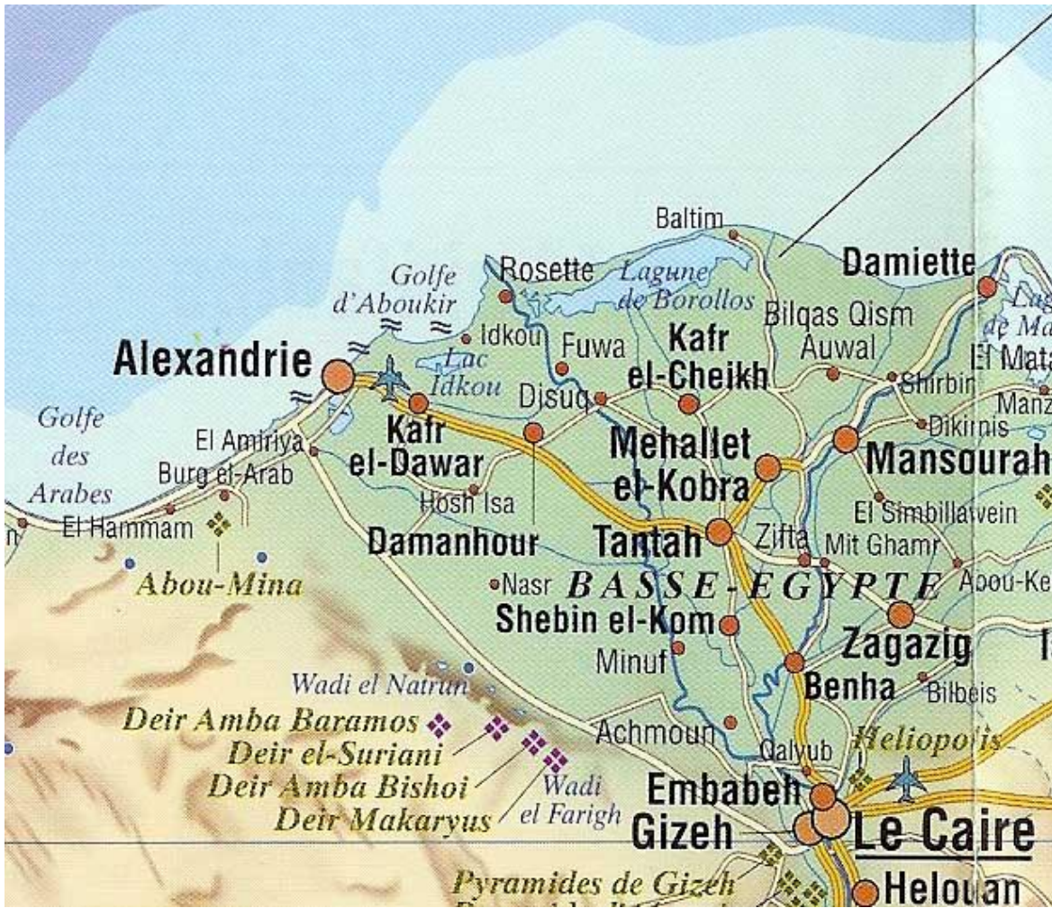
Le Caire – Alexandrie – Damiette – Le Wadi Natroun